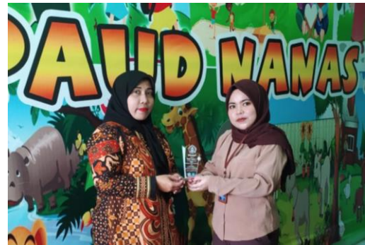
Gambar 8. Penyerahan Plakat

Proses penyerahan plakat dilakukan oleh ketua tim abdimas dan diberikan kepada kepala sekolah PAUD Nanas 1.