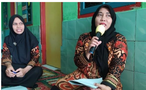
Gambar 6. Dokumentasi Sesi Tanya Jawab

Setelah pemaparan materi selesai diberikan, kegiatan selanjutnya adalah sesi tanya jawab. Para peserta kegiatan diberikan kesempatan mengajukan pertanyaan terkait dengan materi yang telah disampaikan oleh bapak Agung.