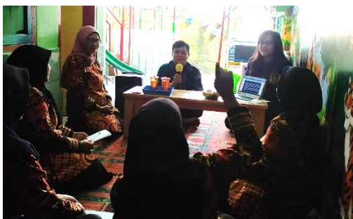
Gambar 7. Dokumentasi Sesi Tanya Jawab