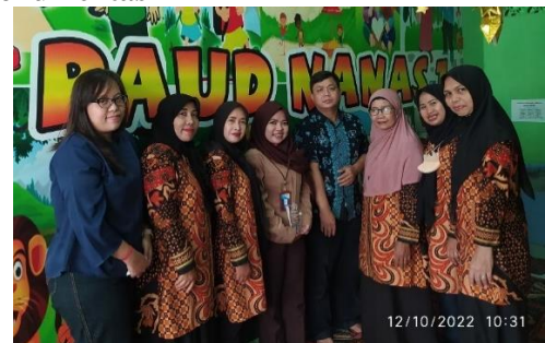
Gambar 9. Dokumentasi tim abdimas dengan mitra