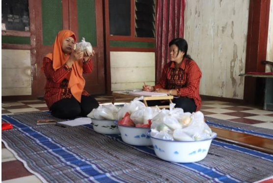
Gambar 3. Pemaparan materi terkait gizi seimbang

seluruh usia termasuk bayi dengan memasukkan ASI sebagai penyusunnya.