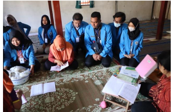
Gambar 1. Pembukaan Kegiatan

Penyuluhan diawali dengan kegiatan pembukaan.