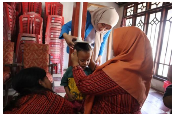
Gambar 2. Pengukuran berat dan tinggi badan

Makanan seimbang pada usia ini perlu diterapkan karena akan mempengaruhi kualitas pada usia dewasa sampai lanjut sehingga pengabdian kepada masyarakat diharapkan dapat meningkatkan status kesehatan balita. Masa balita juga merupakan kelompok yang menunjukkan pertumbuhan badan yang pesat sehingga memerlukan zat-zat gizi yang tinggi setiap kilogram berat badannya.