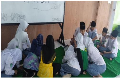
Gambar 1. Pemateri sedang menjelaskan laporan keuangan.