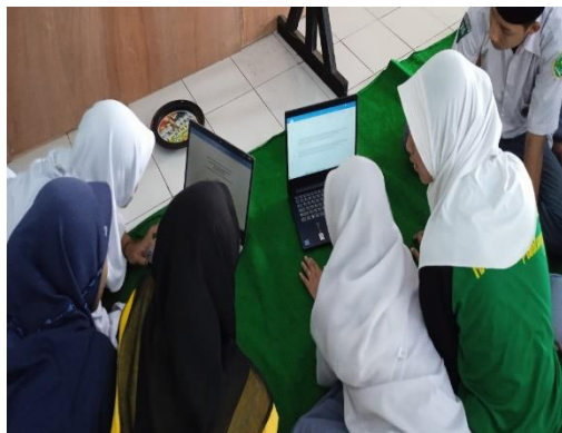
Gambar 3. Peserta yang lain mencoba praktek langsung

Dalam pelaksanaan pelatihan ini, pemateri mengajarkan microsoft dan langsung dipraktekan oleh peserta dikarenakan peserta belum menguasai sepenuhnya tentang aplikasi